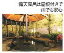
露天風呂は屋根付きで雨でも安心

☎0748-69-0344 滋賀県甲賀市土山町大原1104 9時～15時 OUT / 10時 基本プラン(1泊2食付)1万9650円～2万4050円 272台