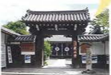
「源氏物語」に登場する花散里の屋敷もこの周辺にあったとされる

現在の蘆山寺の場所にあった曾祖父・藤原兼輔の邸宅で、紫式部は生涯の大部分を過ごしたとされる