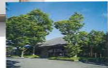
代表銘柄「白龍」「白髪」の乾麺は売店で購入可

涼感たっぷり！ 弾力も十分な 極細麺を堪能 冷やしそうめん 880円 太さ約0.6mmの極細麺「白龍」を使用。ツリ肌ごしがたまらない