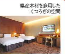
県産木材を多用したくつろぎの空間

☎0744-48-0620 奈良県桜井市高家2220-1 9時～15時 OUT / 11時 基本プラン(1泊2食付)1万5300円～3万2800円 28台