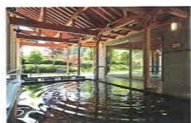
木の温もり溢れる大浴場「癒しの館」