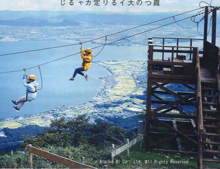
Alpha Bl Co., Ltd. All Rights Reserved