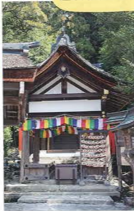
片岡社は正式名称を「片山御子神社」という

かつて片岡社を参拝し、恋の成就を願う歌を詠んだ紫式部。相手は藤原道長だったのかも…?