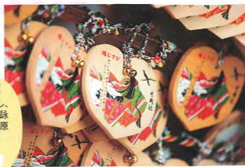
紫式部の歌が書かれたハート型の縁結び絵馬500円