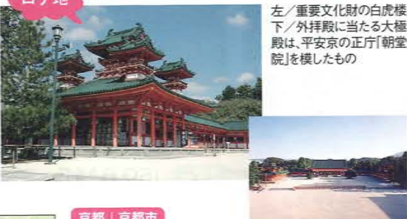
左/重要文化財の白虎楼下/外拝殿に当たる大極殿は、平安京の正庁「朝堂院」を模したものの